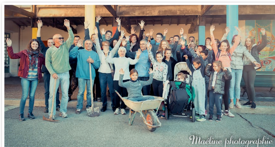
Journée citoyenne 2017

Contribuons ensemble au mieux vivre dans notre commune.